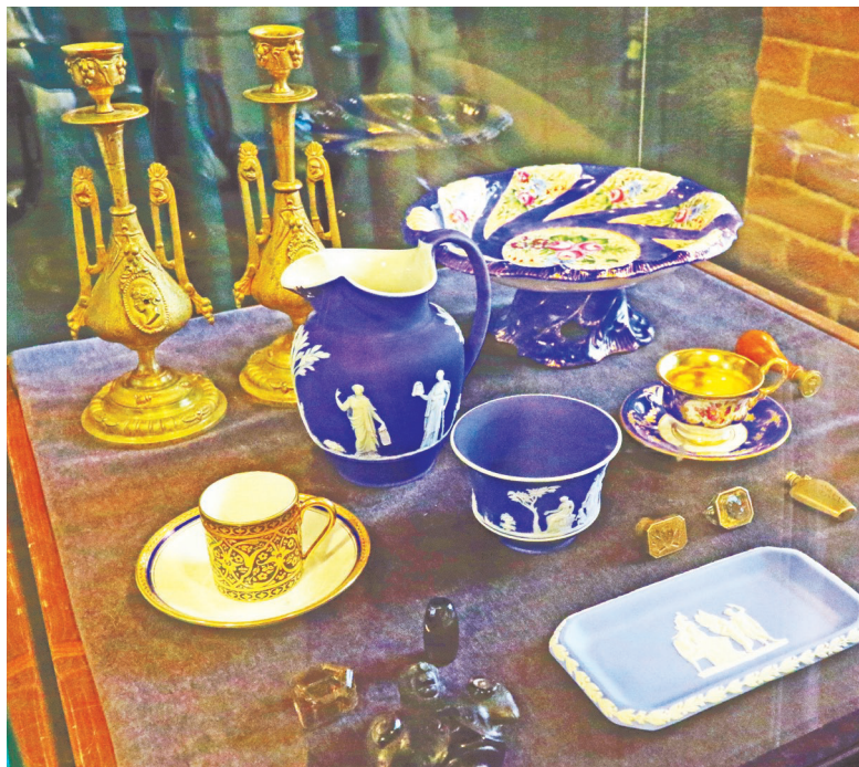
Создатели веджвудского фарфора вторят мастерам Древней Греции и Рима.