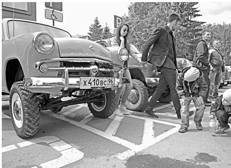
Полноприводный «Москвич-410Н» повышенной проходимости по достоинству оценили в конце 50-х годов на целине.

Захватывающую историю можно рассказать о каждом экспонате. Чего стоит, например, трофейный Opel Kadett 1936 года, на котором, как утверждают хозяева, в 1944 году прямо с фронта вернулся домой, на Урал, некий советский разведчик.