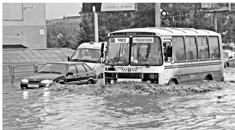
Дороги Челябинска в одночасье превратились в бурлящие реки.

В свое время Ленинский район Челябинска тоже строился без ливневой канализации, напомнили в мэрии. Однако впоследствии в нем устроили два больших коллектора вдоль Копейского шоссе и улицы Барбюса. Там ситуация была под контролем, и ЧП удалось избежать. Михаил Пинкус, Челябинск