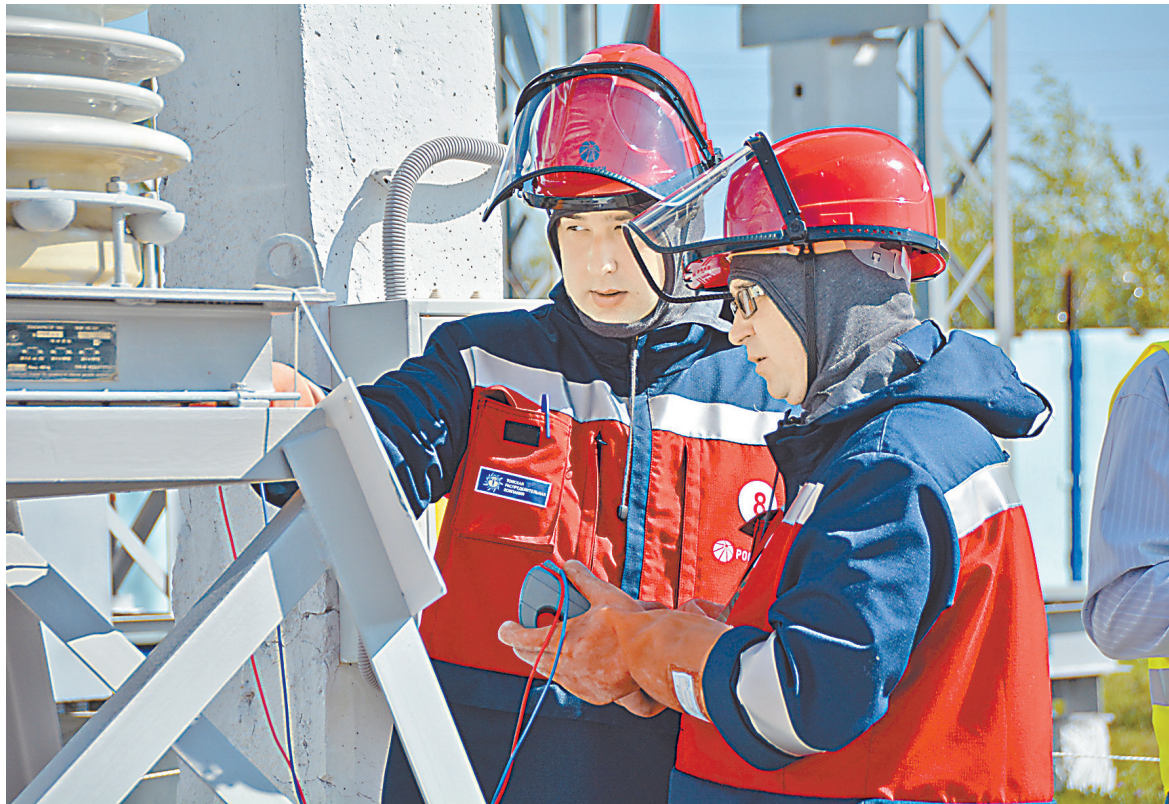
ПРЕСС-СЛУЖБА АО «ТЮМЕНЬЭНЕРГО»

В Нижневартковске назовут лучших специалистов энергетической отрасли России