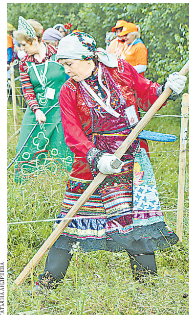
Участницы турнира вышли в поле в национальных костюмах.

Поселок Арти не случайно стал местом проведения соревнований. Здесь действует единственный в стране завод по производству кос.