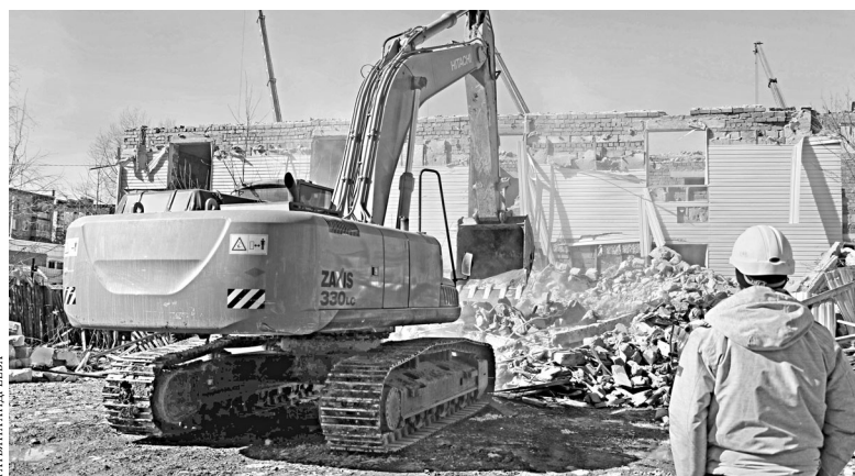
В Екатеринбурге уже снесли 36 домов, построенных на землях ИЖС.

Законопроект ещё находится на стадии обсуждения. Он уже в основном поддержан в министерстве строительства региона. Определены и основные условия участия в программе: рассчитывать на бесплатную квартиру смогут только владельцы жилья, чьи квартиры уже снесены, и получают они ровно столько квадратных метров, сколько потеряли.