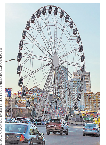
Новое колесо обозрения будет в два раза выше имеющегося.