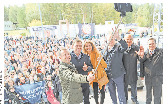
Популярное в молодежных кругах селфи останется на память и организаторам, и участникам форума.