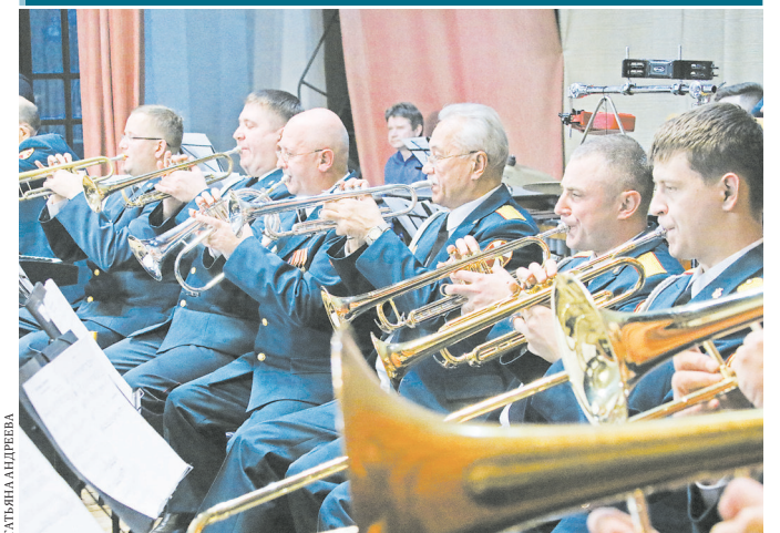
Военный оркестр штаба Уральского регионального командования внутренних войск МВД России отметил свое 85-летие. Во внутренних войсках около 100 оркестров, музыкальный коллектив Уральского командования по праву считается одним из самых титулованных. Оркестр играет на фестивалях и праздниках, дает концерты в других городах. В его репертуаре композиции Дюка Эллингтона и Боба Флоренса, музыка Моцарта, Баха, Шопена, а также военные произведения разных лет.