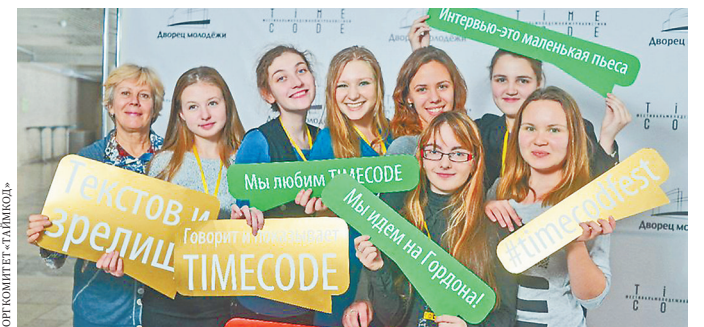
За пять лет «Таймкод» стал путевкой в журналистику для тысяч школьников и студентов.