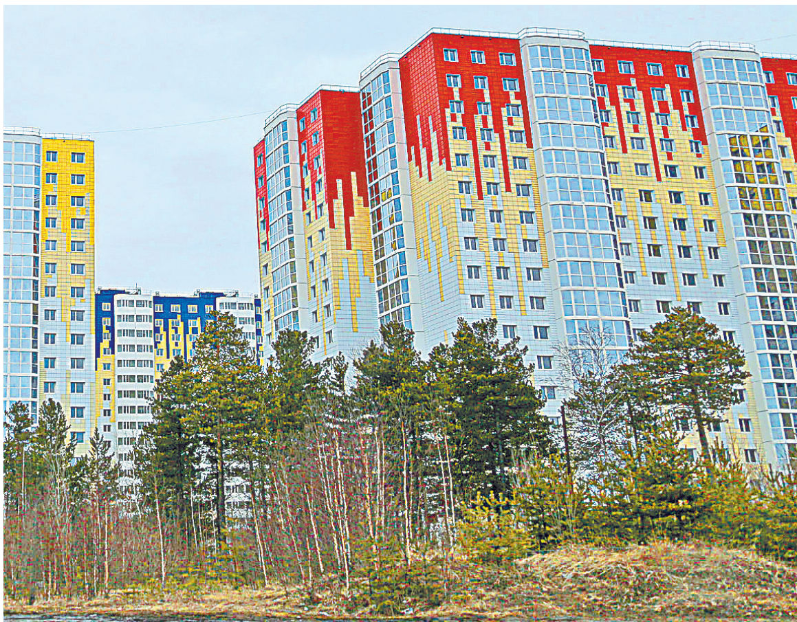
ПОЗИЦИИ ГОРОДОВ УРФО В РЕЙТИНГЕ КРУПНЕЙШИХ ГОРОДОВ РФ ПО КАЧЕСТВУ ГОРОДСКОЙ СРЕДЫ И СТОИМОСТИ ЖИЗНИ

Патриоты Сургута также ссылаются на Варламова, который в