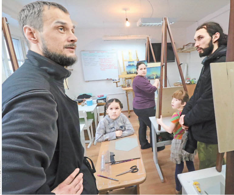
В школе живописи занимаются и взрослые, и дети.

Ребята хором говорят, что у них изменилось отношение к жизни и к окружающим. Они, например, взяли