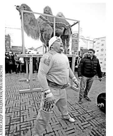
Стронгмэн выбрал для рекорда верблюда, чтобы продемонстрировать уважение к символу Челябинска.