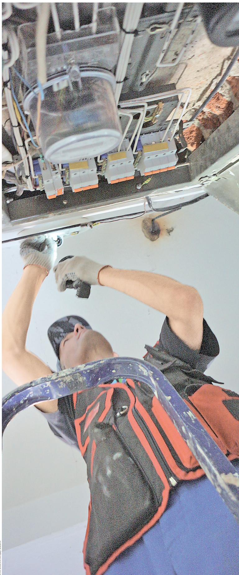
Рачительным собственникам удастся скопить деньги на замену счетчиков и электропроводки в доме.

А жильцы дома № 24 на улице Сыромолотова тоже выбрали спецсчет, только их УК сразу же включила в платежки графу «капремонт». К се-