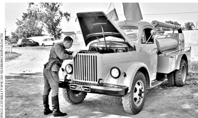
Раритетный ГАЗ-51 на ходу и обладает большим запасом прочности.