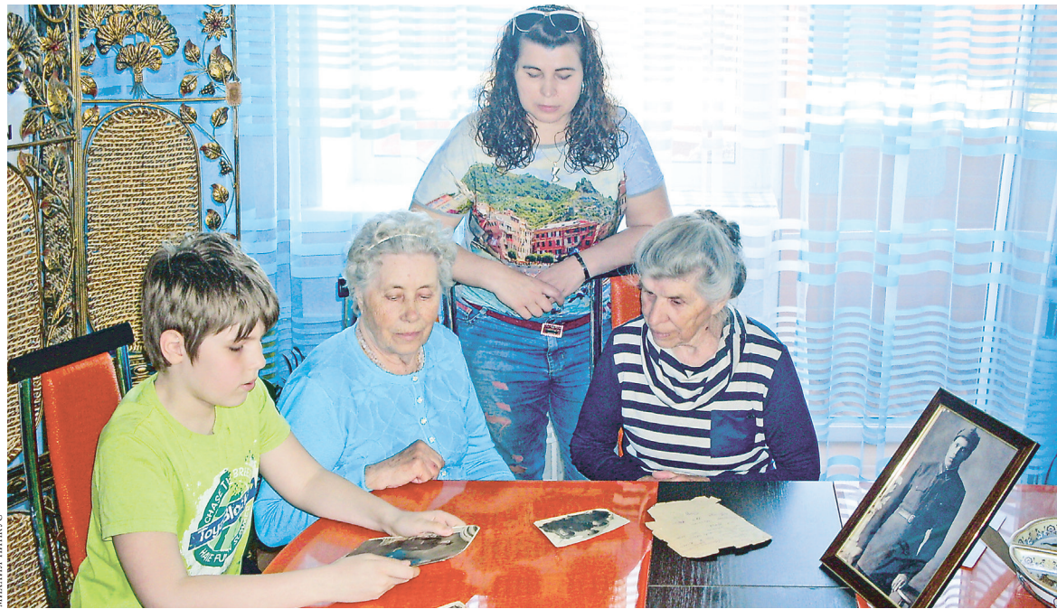
Правнук погибшего бойца Слава хотел бы узнать о прадеде больше.

Ну а дальше про то, как проехали через всю страну — в город Унеча. И что расскажет все через пять месяцев.