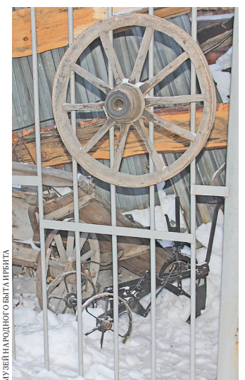
Обломки крыши погребли под собой открытую экспозицию.