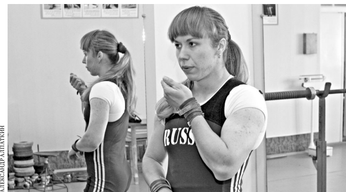
Алла Важенина пополнит копилку олимпийских медалей Казахстана.