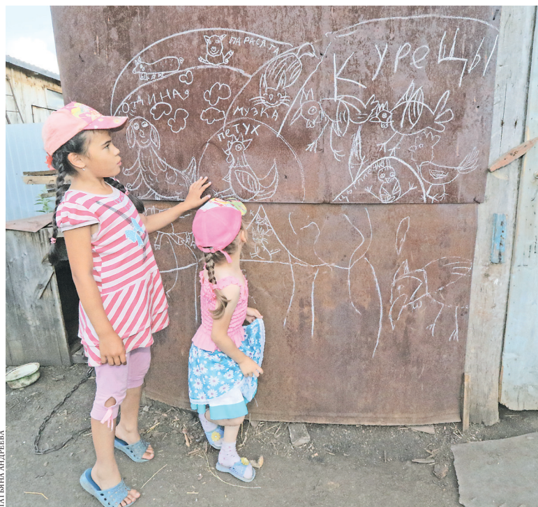
На стене гаража младшие Агайдаровы ведут летопись становления семейного хозяйства.

бятишкам, ведь принес в дом Нюшу и Машу Дед Мороз.