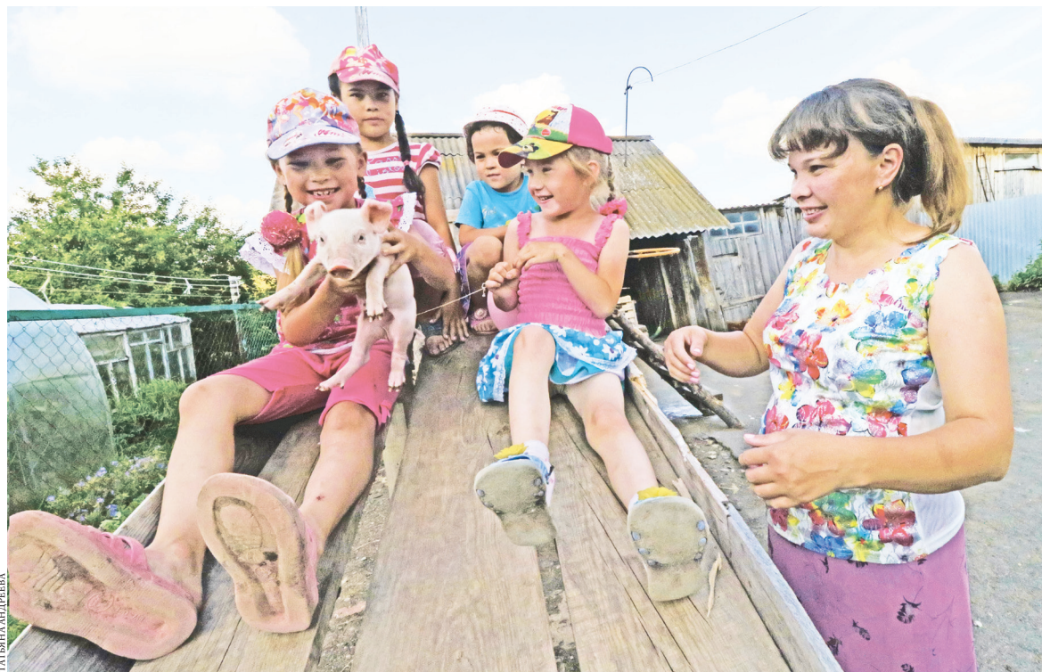
Новорожденные поросята стали любимцами и Эльзы, и ее дочерей, и даже соседских ребятшек.

На картине каждый день появляются новые детали. Юные художницы считают себя полноценными помощниками родителей. А историю появления в хозяйстве поросят, как сказку, рассказывают соседним ре-