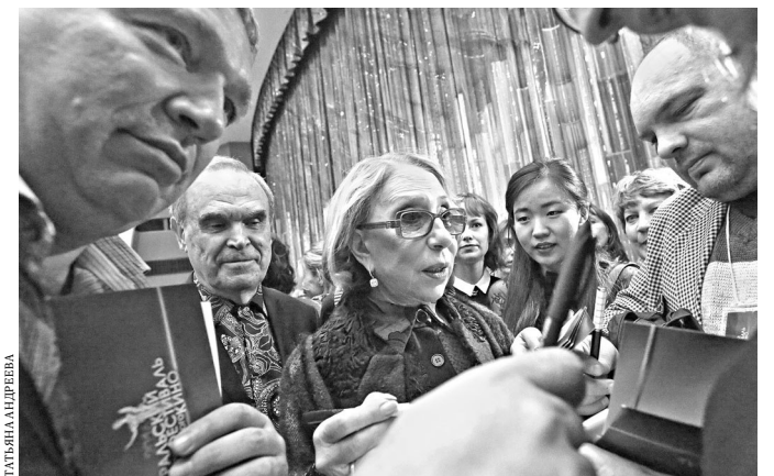
В 2016-м гостями фестиваля стали Инна Чурикова и Глеб Панфилов.