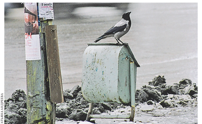
По мнению орнитологов, вороны очень умны, они знают, что делают.