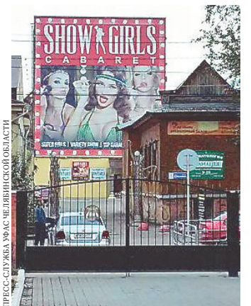
Реклама развлекательного заведения расположена прямо перед окнами гимназии.