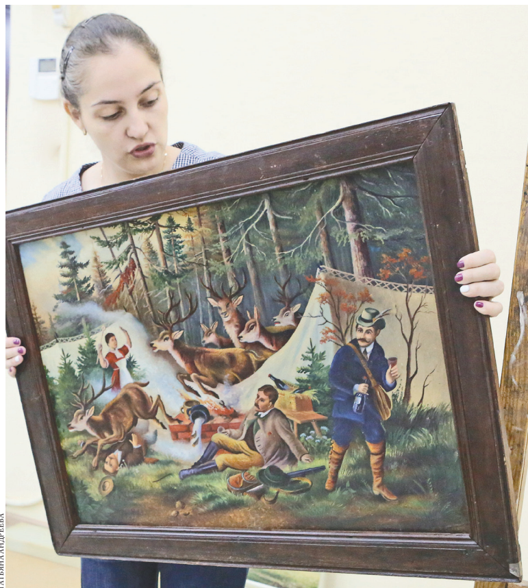
Дух народных сказаний живет на полотнах уральского самородка.