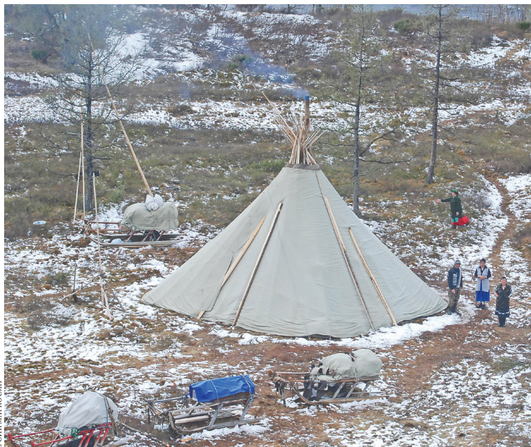
Рядом с Саранпаулем нередко останавливаются кочующие оленеводы.

нического вуза, после его окончания свежеепеченного бурового мастера отправили в Тюмень: «Там узнаешь, куда далее».