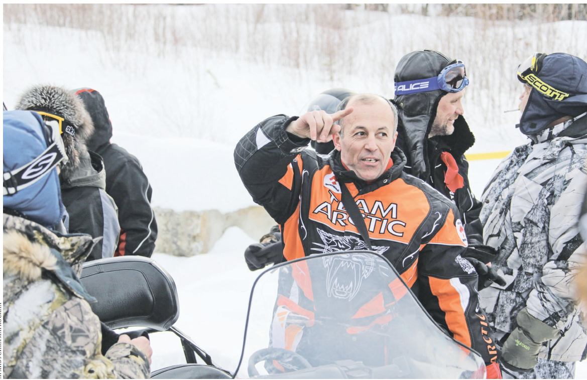
Усик (в центре) любит выбираться в горы, нередко вместе с группами туристов.

Как он тут, спросите, очутился? По распределению. Паренек из горного кавказского селения поступил в Ереване на горный факультет тех-