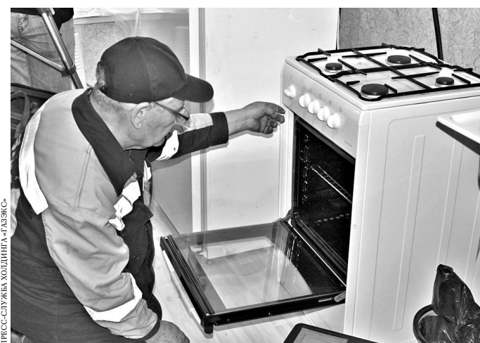
Специалисты уже инструктируют жильцов, как правильно пользоваться газовым оборудованием.