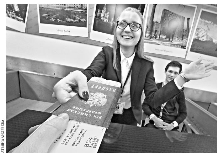
Минск — новое направление екатеринбургского авиаузла.