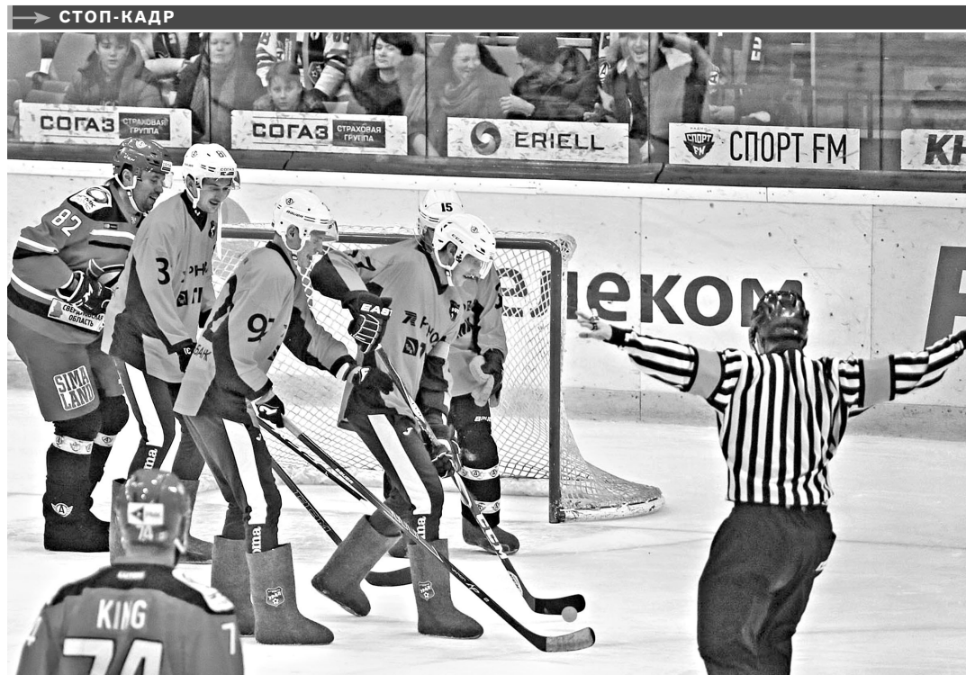
Игроки двух екатеринбургских клубов — хоккейного «Автомобилист» и футбольного «Урал» — провели благотворительный матч в валенках на льду. Первый тайм спортсмены сыграли в хоккей, второй — в футбол. Хоккейную часть «Автомобилист» выиграл со счетом 5:1, в футбольном тайме победу одержал «Урал» — 2:1. Сборные от матча — более 488 тысяч рублей — передали школе-интернату, где обучаются дети с ДЦП.