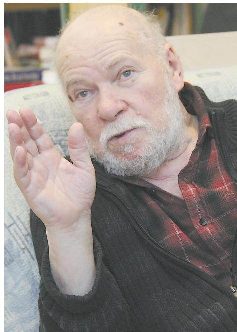
Брусиловский — единственный уральский живописец международного уровня, вписавший Екатеринбург в список культурных столиц.