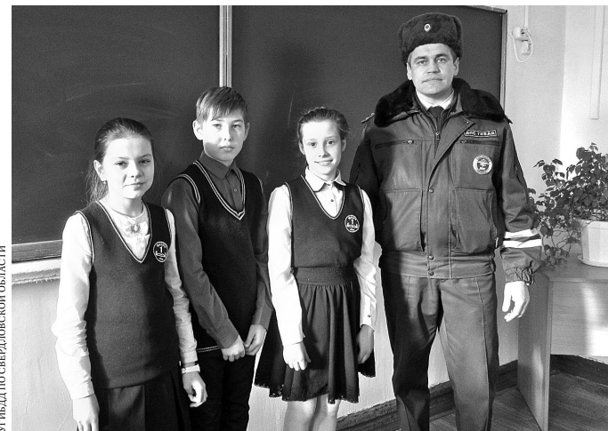
УЧИЛЬЦА ПО СВЕРДЛОВСКОЙ ОБЛАСТИ

Пятиклассники вспомнили госномер автомобиля и помогли найти сбившего бабушку водителя.