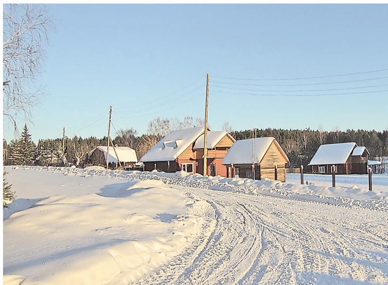
Большую часть года Аник пустует.