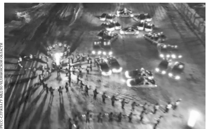
Машины ДПС образовали цифру 8.