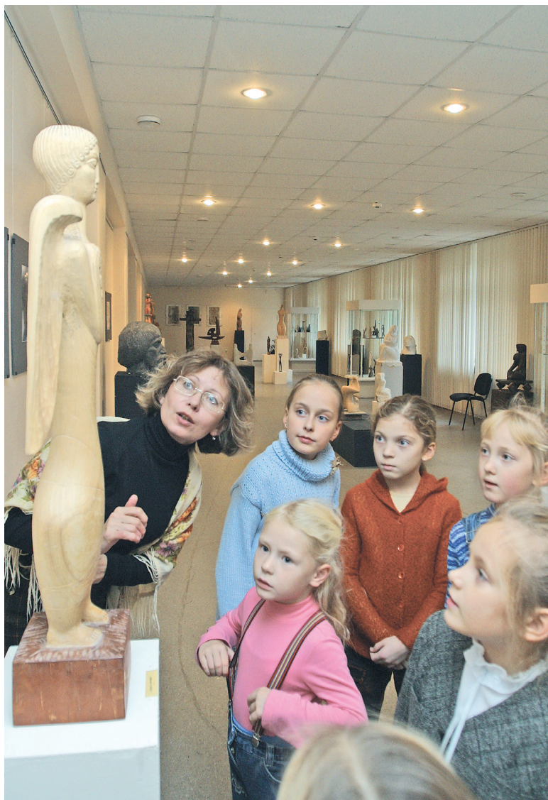
В Тюменском музее изобразительных искусств.

Областной департамент культуры распорядился в считанные дни очистить помещения — подготовить к перемещению 16,5 тысячи экспонатов. Куда? В фондохранилище строящегося поблизости уже пару десятков лет музейного комплекса. Как раз установились сильные морозы. Чем была вызвана спешка, попирающая жесткие регламенты перемещения музейных ценностей? Оказалось, здание поставлено на капремонт, надо срочно обследовать конструкции. Музей будет иной, на стенах вместо привычных картин — мультимедийные проекции. Из бюджета направлено более 10 миллионов на проектно-сметную