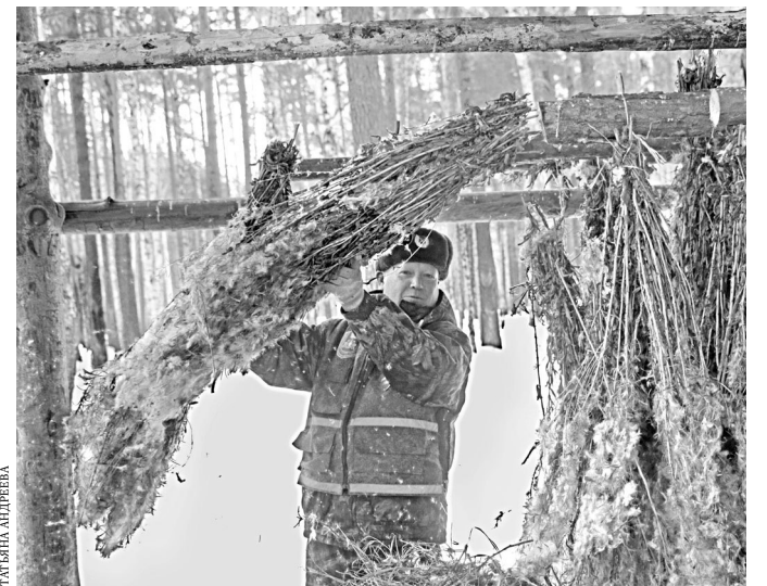
Веники из иван-чая лесники заготавливают для лесей.