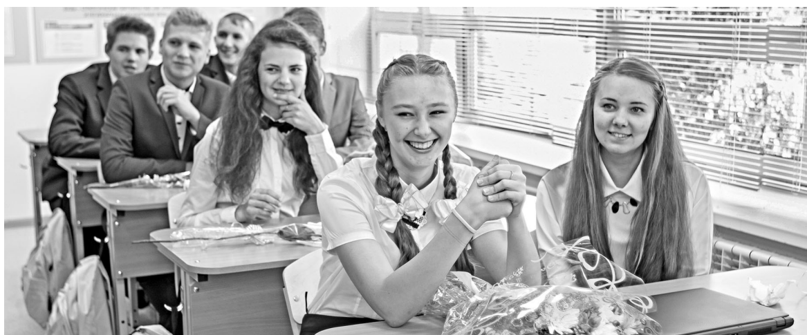
Девушек в «нефтяных» классах Туртаса не менее половины.