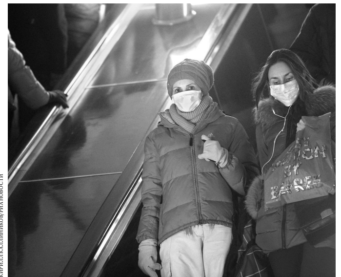
Медики рекомендуют надевать маски в торговых центрах и общественном транспорте.