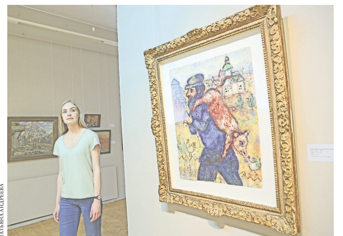
«Барана» Марка Шагала ценители искусства увидят впервые.