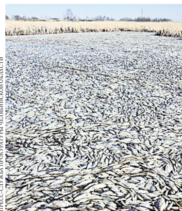
У берегов Кунашака всплыли тонны мертвой рыбы.