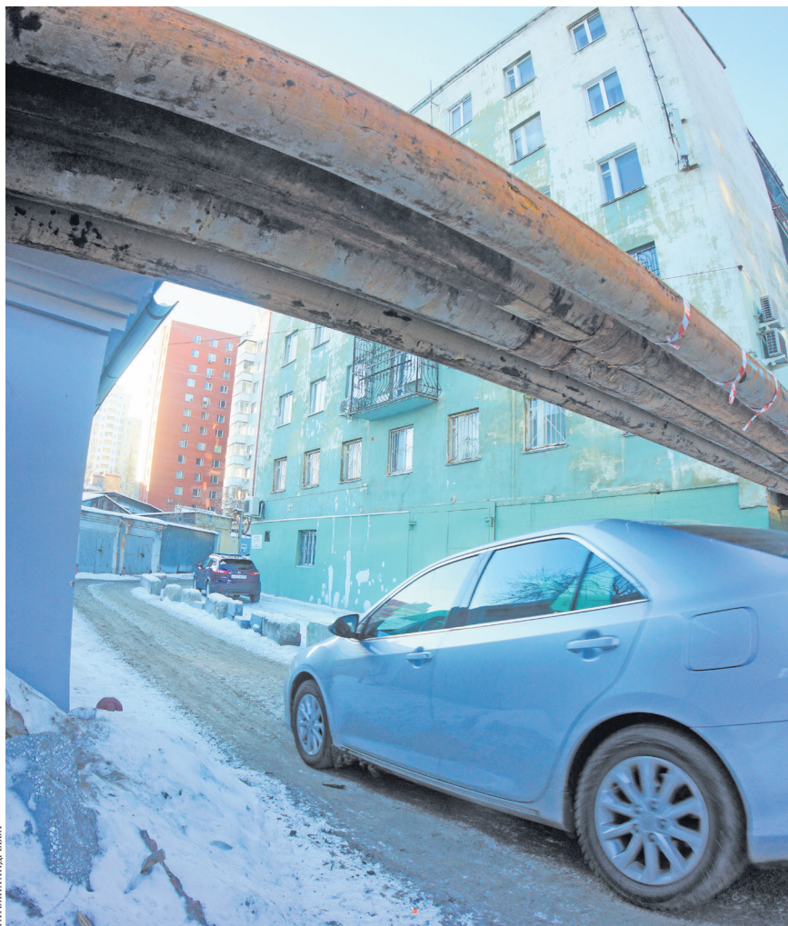
К дому № 15 на улице Вайнера ведет узкая дорога под трубой теплотрассы.

Но если исследование плит может только сдвинуть сроки, то жители дома № 15 на улице Вайнера, кажется, готовы уже пойти на баррикады, чтобы не допустить возведения под своими окнами основного здания центра. О несогласии с проектом они буквально кричат уже несколько лет, но безрезультатно. На днях жильцы отправили очередное возмущенное письмо в мэрию Екатеринбурга. Но на конструктивный ответ, признаются, уже не надеются, поэтому обратились в «РГ». Мы приводим доводы обеих сторон. Это не первый и не последний конфликт между горожанами, отстаивающими право на нормальную жизнь, и чиновниками, утверждающими, что во главу угла надо ставить не личные, а общественные интересы.