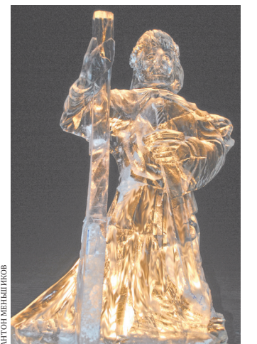
Авторы изваяния князя Владимира призвали земляков беречь ледяную скульптуру.