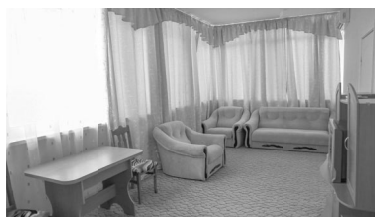
Из окон отеля открывается великолепная панорама города, бескрайние морские просторы и завораживающая красота природы.