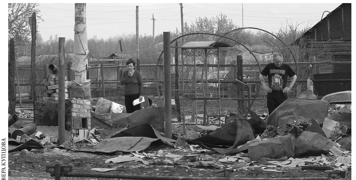
Больше всего от пожара пострадало село Мыржайское Мишкинского района.