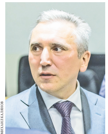
Александр Моор поступил на госслужбу в 2001 году.