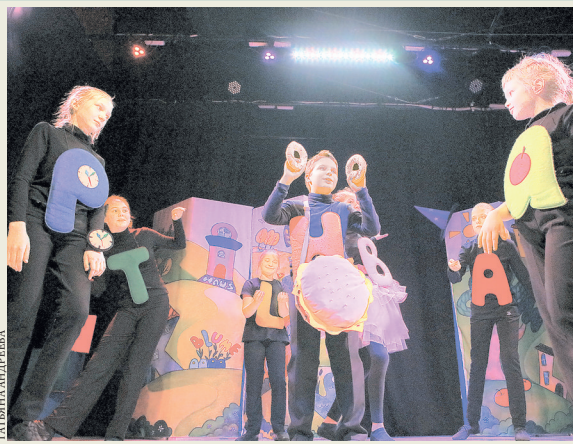
Школьники удачно вжились в роль заколдованных букв, из-за которых слова поменяли свое значение.

Спектакль представят широкой публике в октябре. А уже летом авторы начнут писать новый мюзикл.