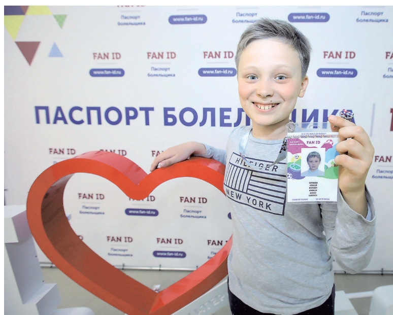
Владельцы паспортов болельщиков смогут бесплатно проехать на скоростной «Ласточке».