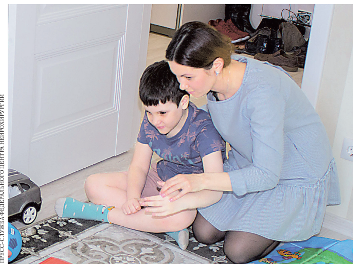
ПРЕСС-СЛУЖБА ФЕДЕРАЛЬНОГО ЦЕНТРА НЕЙРОХИРУРГИИ