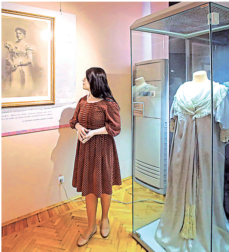
В этом шелковом платье Александру Федоровну видели только домашние.

Екатеринбуржцы узнают о частной жизни семьи Николая Второго