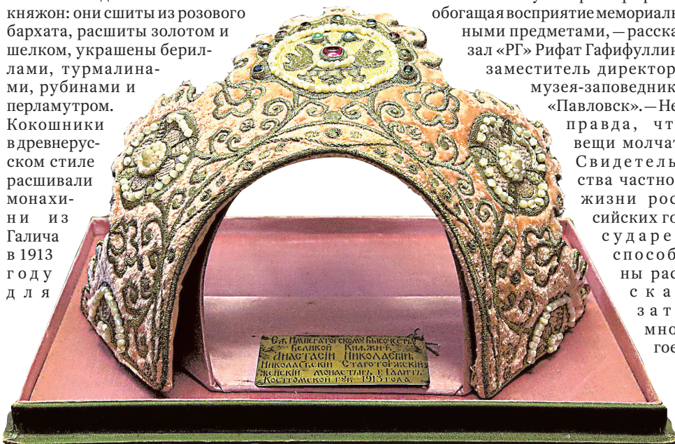
Кокошники в древнерусском стиле расшивали монахини для торжеств в честь 300-летия дома Романовых.

Что касается драгоценностей, то на выставке есть два кокошника великих княжон: они шиты из розового бархата, расшиты золотом и шелком, украшены бериллами, турмалинами, рубинами и перламутром. Кокошники в древнерусском стиле расшивали монахини из Галича в 1913 году для