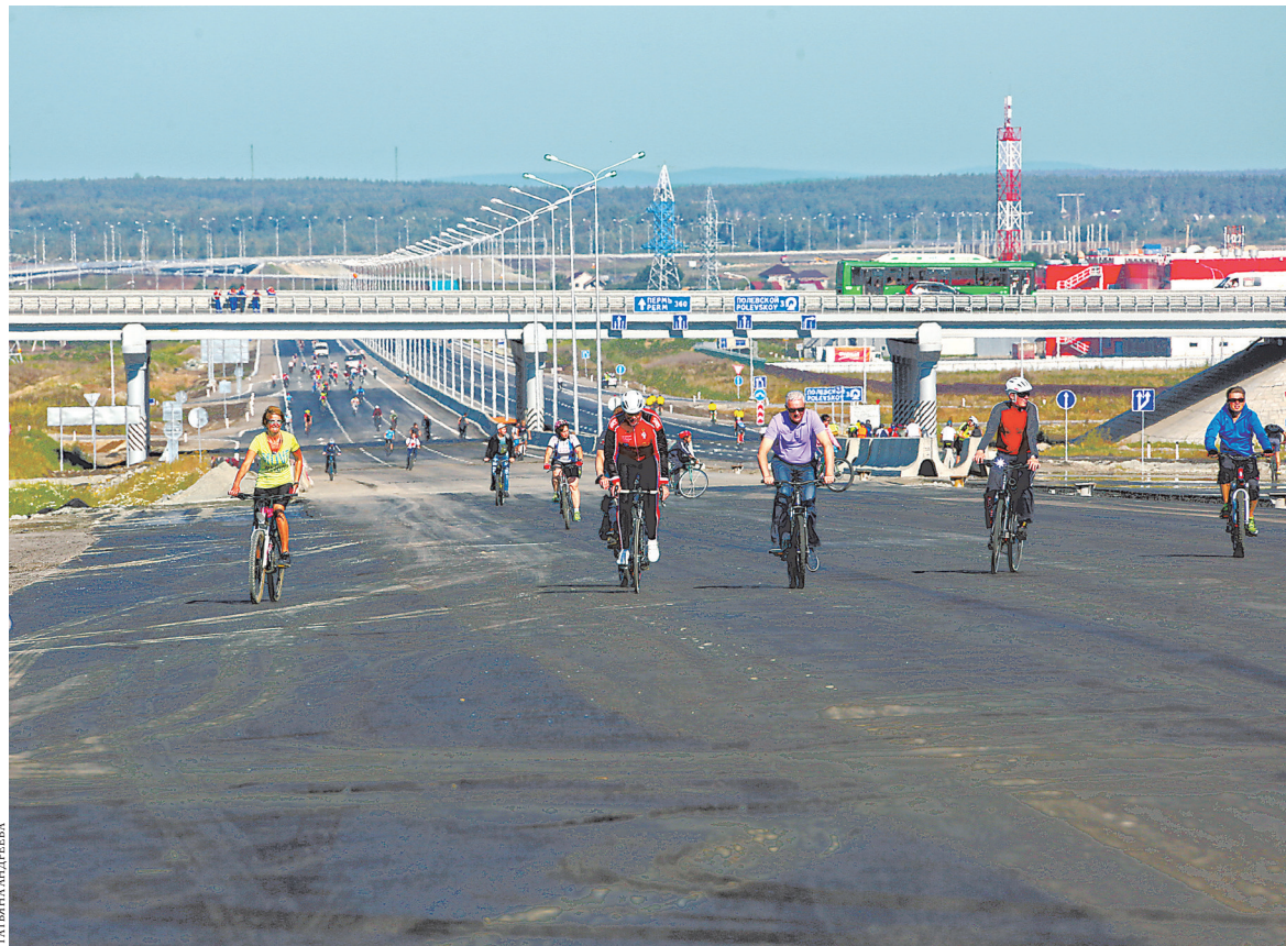
На строительство участка ЕКАД от поселка Медного до Полевского потрачено 256 миллионов рублей.

Этому коллективному саду не повезло вдвойне: он находится на быв-