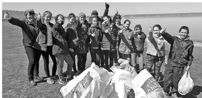
Аргаяшцы собрали более 40 тонн мусора.