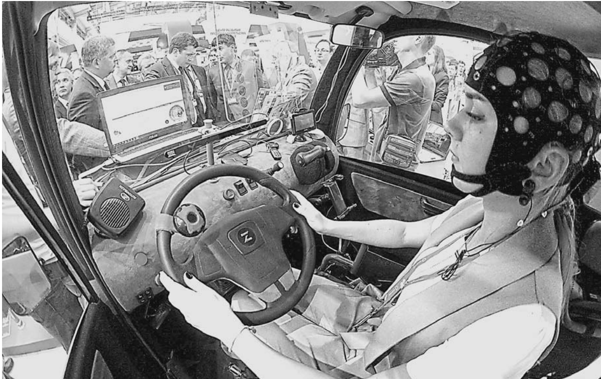
Первый в мире автомобиль, управляемый мозгом человека, представлен на международной выставке «Иннопром» в Екатеринбурге. Машина реагирует на мысленные команды водителя. В нейромобиле привычную систему управления (педали, рычаги переключения скоростей) заменяет умная начинка, реагирующая на биологические импульсы, которые передаются с помощью особого головного убора автомобилиста. На выставку привезли пилотный образец, разработанный молодыми учеными университета Лобачевского в Нижнем Новгороде. Серийный выпуск нейромобиля планируется начать через три года.