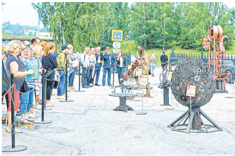
Выставка скульптур «Ломосфера-2018» расположилась на открытой площадке музея «Северская домна». Экспозицию можно посетить до 18 августа 2018 года.

В Полевском провели конкурс скульптур из металлолома