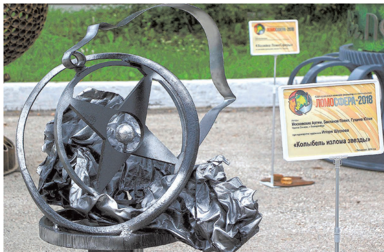
Арт-объект «Колыбель излома звезды», по словам его создателей, молодых сотрудников Группы Синара, — это символ сердца, несмотря ни на что стремящегося к любви.

шихты до трубы. С переработкой металлолома он сталкивается ежедневно, вот и изобразил то, что ему знакомо и понятно.