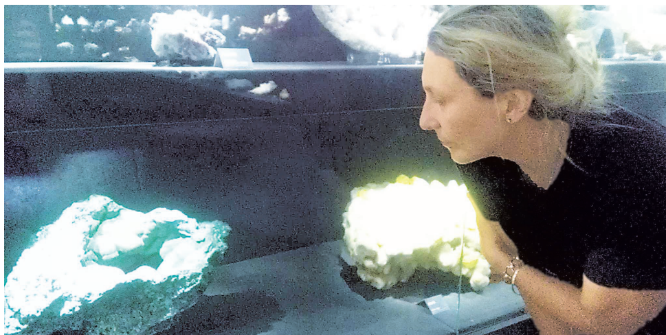
Посетителей музея во Флоренции удивляют размеры уральского камня, но в Нижнем Тагиле и в Екатеринбурге выставлены гораздо более впечатляющие экземпляры.

Надо заметить, что подарки Анатолий Демидов, имея двухмиллионный годовой доход, делал царские. Так, Папе Пию IX он преподнес полутораметровый малахитовый крест, который сейчас находится в библиотеке Ватикана, директору Венского музея естественного знания Морису Херсту — самородок платины разме-