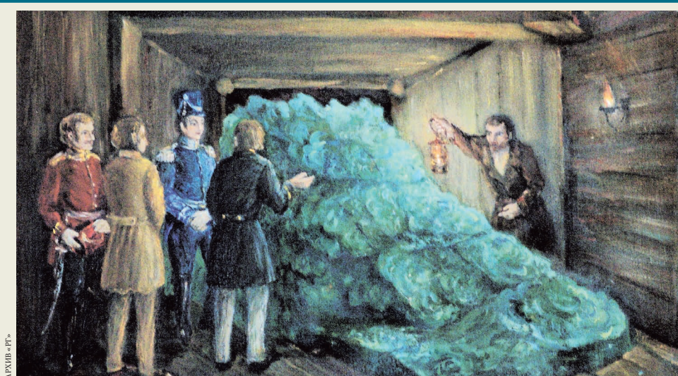
альности все Каменные цветки сделаны из бронзы или дешевого камня и обклеены тонкими пластинками малахита. И кстати, флорентийских демидовских малахитов вполне хватило бы на вазу внушительных размеров.

До этого сенсационного открытия малахит считался только ювелирным камнем, потому впечатление от находки было таким же, как от, например, рубина или изумруда в два человеческих роста. «Король малахита» Анатолий Демидов превратил ювелирный камень в декоративный. Представленные в Лондоне на первой всемирной Экспо-1851 облицованные малахитом гигантские вазы и парадные двери поразили публику. «Прославленный незнакомец, до сих пор известный только ювелирам и гранильщикам, появился в отполированном зеленом пиджаке: кто он, откуда пришел и как сделан его пиджак? Оказалось, его зовут Малахит, он из русской семьи, а его куртка, как у Арлекина, представляет собой лоскутное одеяло из кусочков», — так поэтично описывала явление малахита английская пресса. Под одеялом имеется в виду так называемая русская мозаика: Данила-мастер, вытесывающий цветок из монолита, — это сказка, в ре-