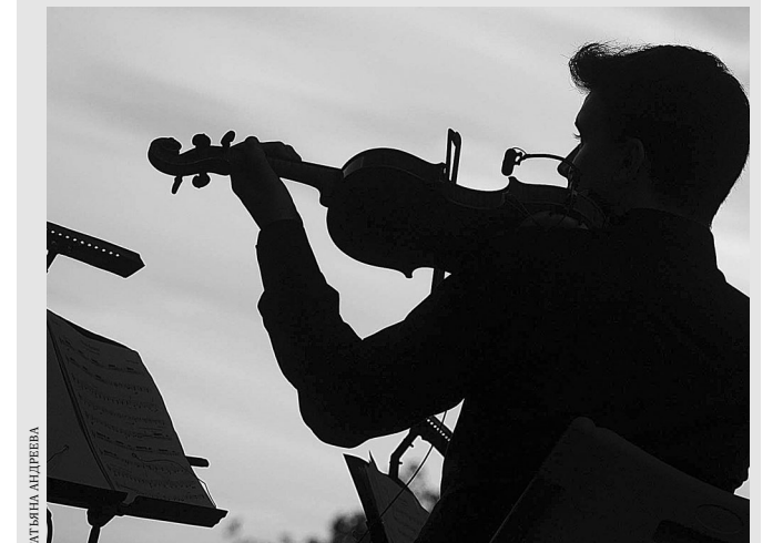
Девятый Венский фестиваль открылся большим концертом — первым выступлением в России ансамбля классической музыки Obertron String Octet из австрийского Граца.

Среди хитов праздника искусств — концерт «Хаваша симфоник-арена шоу», знаменитого музыкального обозрения, в котором участвуют 150 исполнителей от Армении до Индии. На огромном экране зрители увидят записи опер «Милосердие Тита» Моцарта (по трансляции из Зальцбурга, за пультом Теодор Курентзис), «Ромео и Джульетта» Гуно с Хуаном Диего Флоресом и Аидой Гарифуллиной (за пультом Венской оперы Пласидо Доминго), «Аида» Верди с Анной Нетребко (трансляция из Зальцбурга, дирижер Риккардо Мути).