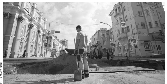
Ремонт сетей на улицах Кургана продолжится до середины октября.