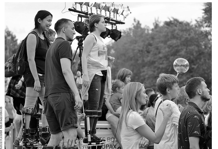
Зрители, пришедшие на представление на ходулях, с комфортом наблюдали за происходящим на сцене.