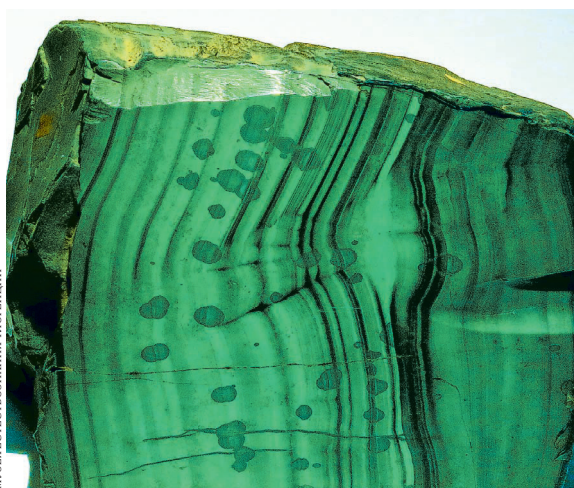
Фото малахита (каталожный номер 135286), преодолевшего 5000 км из Нижнетагильска во Флоренцию, публикуется с любезного разрешения Музея естествознания Флоренции.