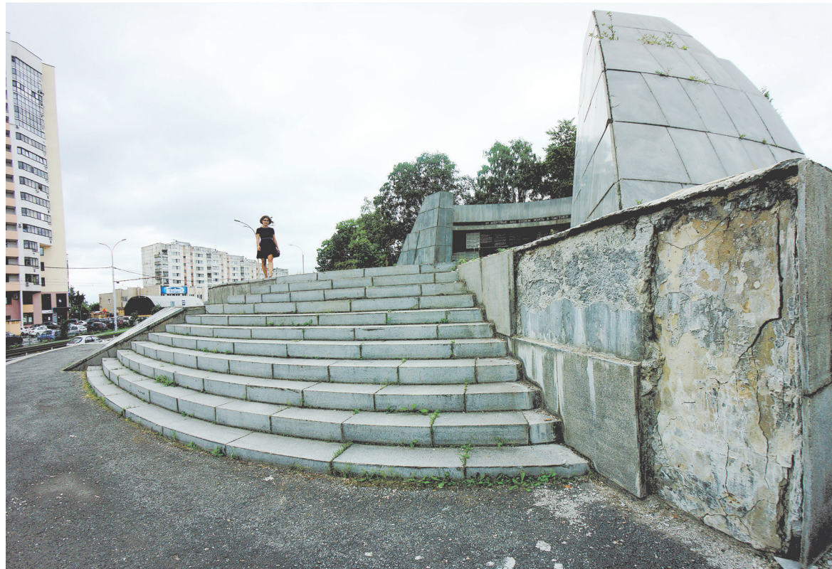
Первый в СССР мемориал, увековечивший память жертв террора 30-х годов, расположен практически в центре Екатеринбурга.

Еще можно прочесть крупную надпись: «И мертвые мы будем жить в частице вашего великого счастья, ведь мы вложили в него нашу жизнь». Но величия, находясь здесь, не ощущаешь. Вокруг царствуют разруха и запустение. В окружении