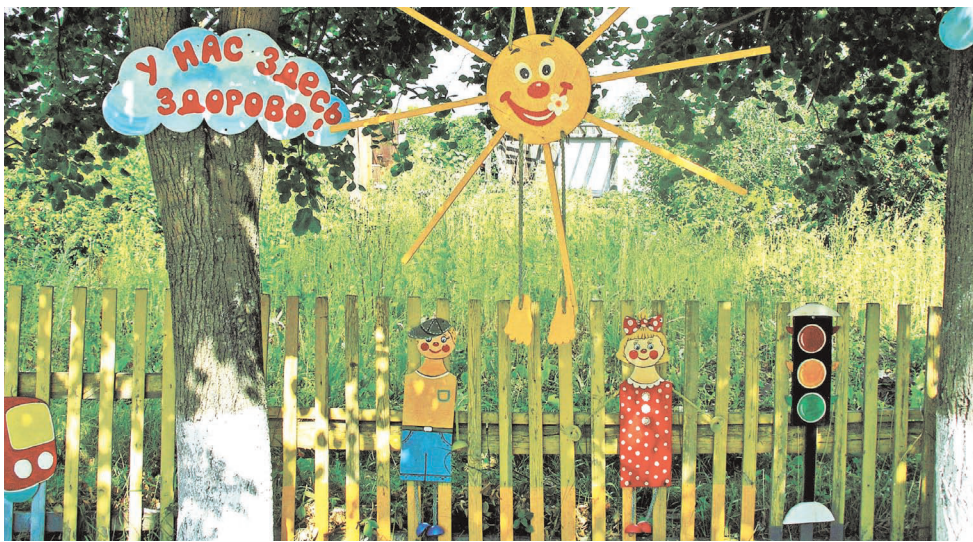
Вложения в детские учреждения — это вклад в благополучие наших сотрудников, считают в «ФОРЭС».

Уральские компании помогают образовательным учреждениям