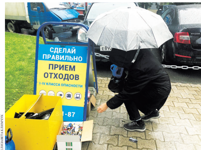
Некоторые адреса приема ртутьсодержащих ламп нам подсказали екатеринбуржцы.