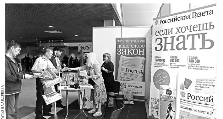
Стенд «Российской газеты» на международной выставке «Иннопром» пользуется неизменной популярностью уже много лет.