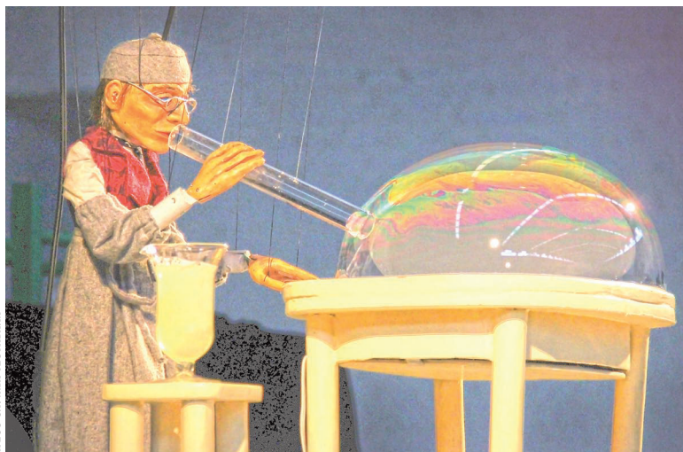
Марионетка-алхимик мастера Бертрана выдувает мыльные пузыри внушительных размеров и исключительной красоты.