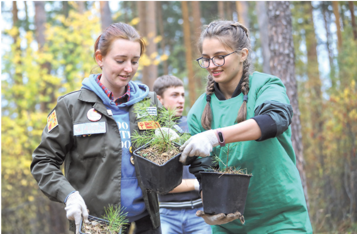
Пять тысяч саженцев деревьев, в том числе сосны, высадили на двух гектарах Шарташского лесопарка участники состоявшегося в Екатеринбурге чемпионата России среди вальщиков леса. Лесорубы позвали себе на помощь волонтеров.