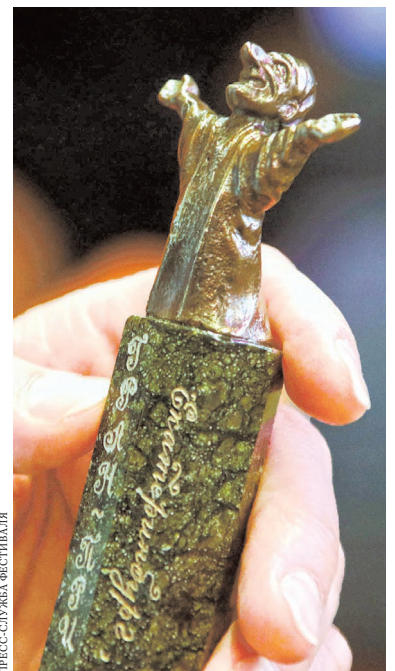
Жюри этого года сожалеет, что на всех Петрушек не хватило.