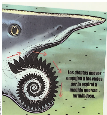
В Красноуфимске даже детсадовцы знают, как зовут рыбу с циркулярной пилой вместо языка—геликоприон.