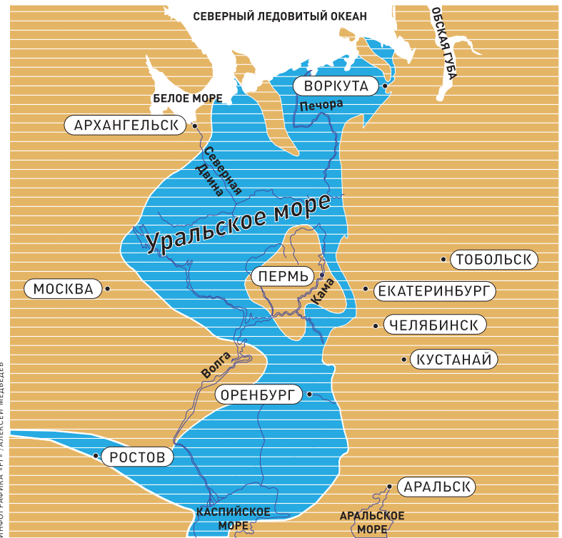
Палеографическая карта пермского периода (300—250 миллионов лет назад), когда у подножия молодых Уральских гор плескалось Уральское море, Пермский край был островом, а через Красноуфимский район проходил глубокий пролив.

Надо заметить, что ее талант собирателя распространяется и на со-