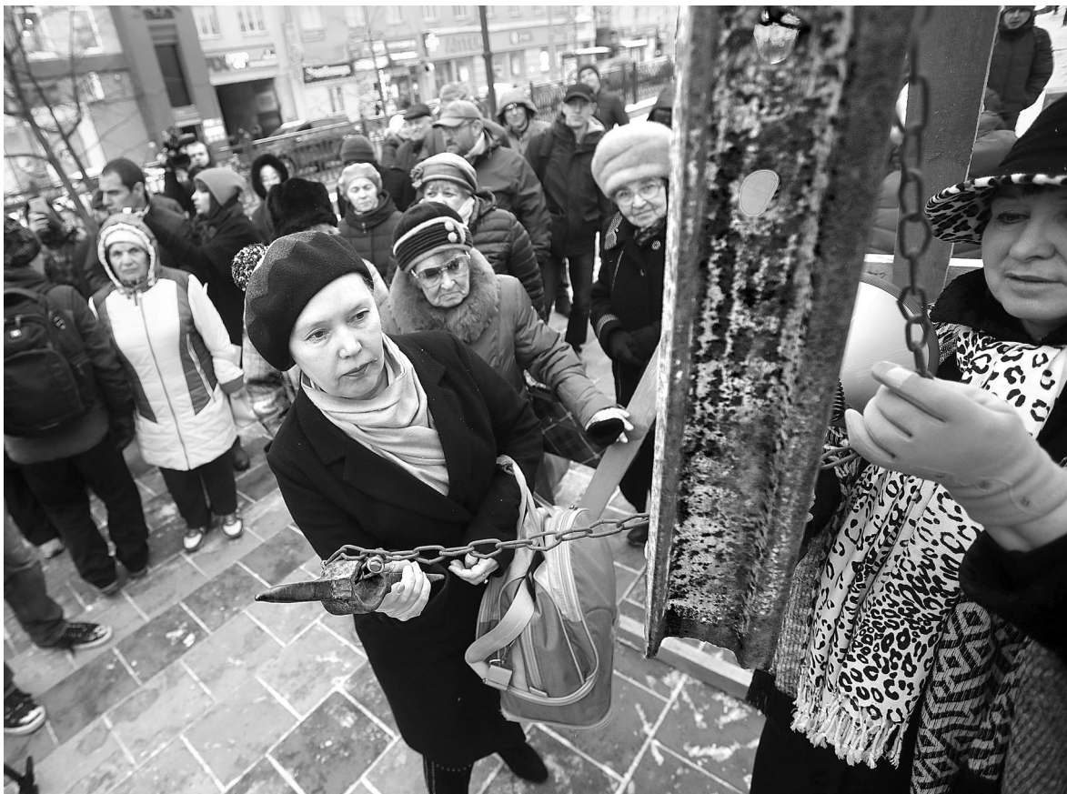
В центре Екатеринбурга 30 октября установили «Колокол памяти» — висящий на цепи рельс, в который могут ударить все желающие, чтобы почтить память жертв политических репрессий. По традиции в этот день в городе прошла мемориальная акция «Возвращение имен»: ее участники зачитали имена уральцев, погибших в годы террора.