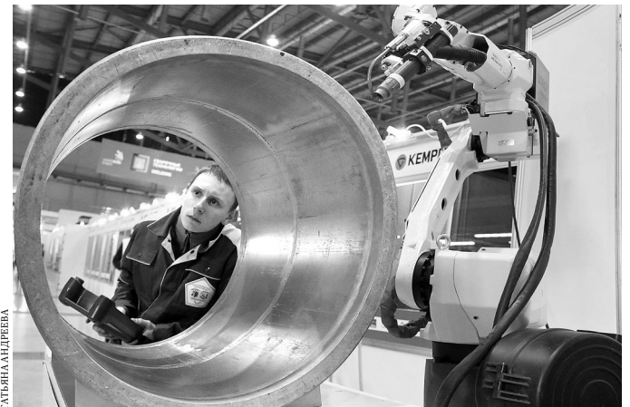
Несколько десятков комплектов наград разыграли на Международном чемпионате рабочих профессий WorldSkills Hi-Tech, прошедшем в Екатеринбурге. В мастерстве состязались 36 команд из России и еще девяти стран. Участники продемонстрировали профессионализм в различных специальностях — от металлообработки до обслуживания космических систем. Среди лидеров по числу побед — сотрудники холдинга ЕВРАЗ: на счету металлургов 17 наград.