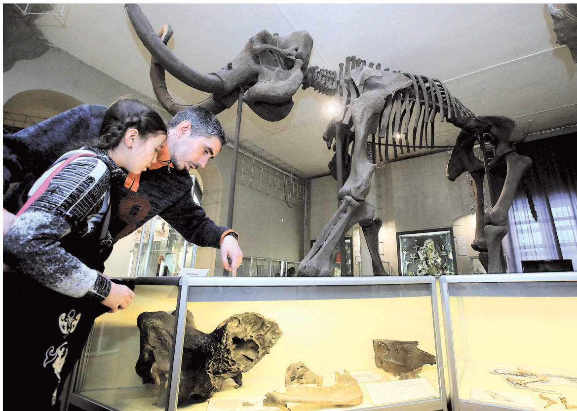
В Музее природы Урала фрагмент черепа сибирского единорога хранится рядом со скелетом его современника-мамонта.

Сенсационное международное исследование началось с зуба, обна-