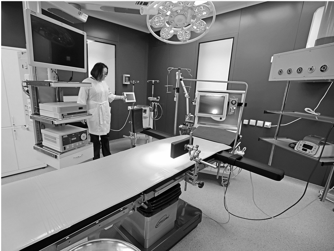
На Среднем Урале завершилась реконструкция хирургического корпуса и операционного блока Верхнепышминской центральной городской больницы им. Бородина. На капитальный ремонт и оснащение медицинского учреждения новым оборудованием областной бюджет выделил более 210 миллионов рублей. От постройки 1973 года остались только стены.