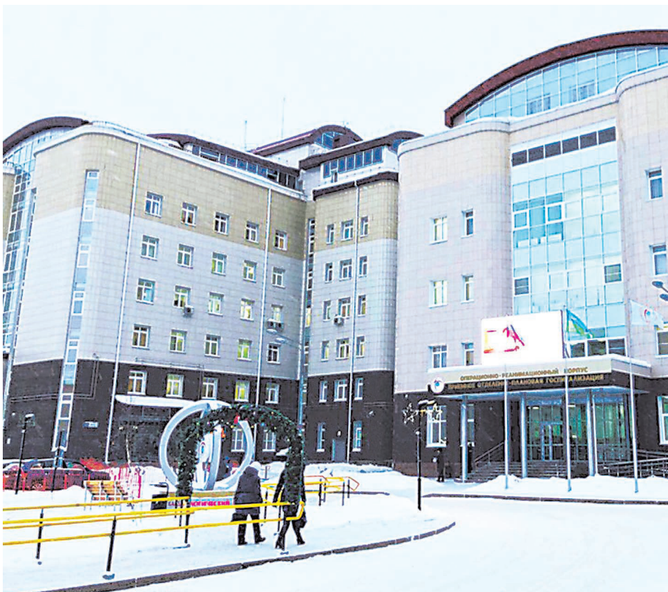
Вокругном центре диагностики и сердечно-сосудистой хирургии, открытом в Сургуте весной прошлого года, оперируют и новорожденных с патологиями, и долгожителей. Возраст самого пожилого пациента — 97 лет, ему имплантировали электрокардиостимулятор.

Не все из передовых начинаний потребовали серьезных финансовых вложений. Многие зародились из простого желания докторов сделать приятное землякам. К примеру, почти перед всеми больницами и поликлиниками Сургута задолго до Нового года появились праздничные ели. Каждая — со своей фишкой. Около уже упомянутой четвертой поликлиники сверкающий огоньками олень везет санки с «мешком здоровья». Перед кардиоцентром красуется веселый снеговик с огромным шприцем, вроде того, что используют герои комедии «Кавказская пленница». А у детской поликлиники расположился доктор Айболит с компанией зверей. Вроде бы мелочь, но знаю точно: не каждый глав-