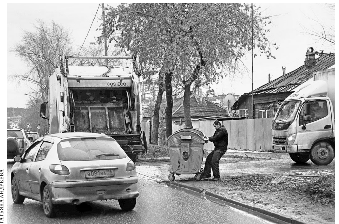
Норматив накопления мусора в частном секторе Челябинска — 1,6 кубометра на человека.