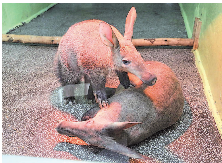
Трубказубы очень привязаны друг к другу.

Влучших зоопарках мира, например в Праге и Лондоне, трубказубы приносят приплод примерно раз в десятилетие. Екатеринбургские зоологи добились практически еже-