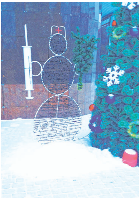
Медик-снеговик с полуметровым шприцем в руках, установленный перед входом в центр, по мнению врачей, символизирует готовность вылечить любого, кто переступит порог больницы.

врач готов разориться на уличные «украшалки».