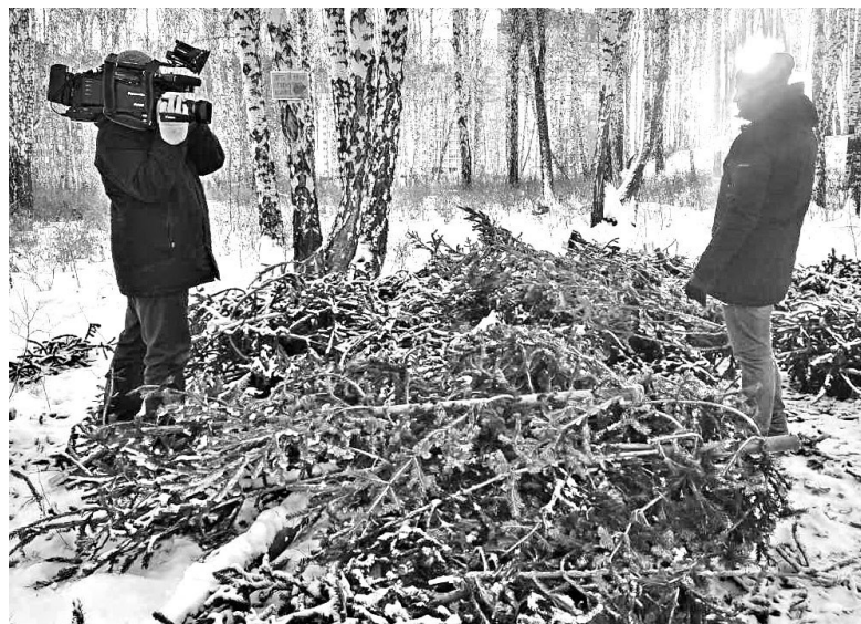
Торговцы побросали непроданные ели прямо на улице или в лесопосадках в черте города.