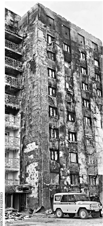
Фасад здания практически полностью выгорел.