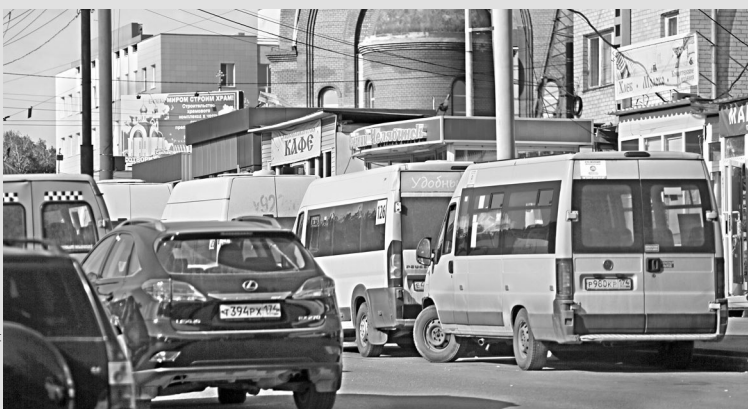
Новые правила должны увеличить пропускную способность перекрестков.