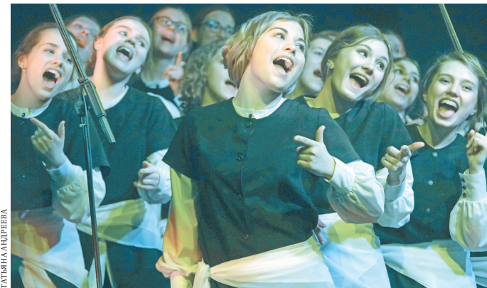
По задумке режиссера, Джаз-хору пришлось много двигаться, меняя образы и настроения.