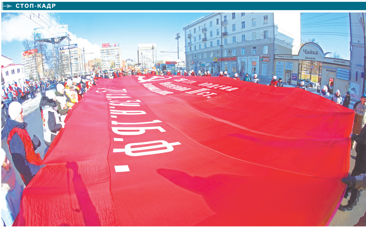
На Среднем Урале прошел Межрегиональный форум волонтерских отрядов «Здоровье нации в наших руках: добровольчество». Он объединил около тысячи добровольцев—представителей волонтерских, общественных организаций и образовательных учреждений из российских регионов. Гости форума провели шествие «Добровольцы: Россия в моем сердце» по центральным улицам Екатеринбурга, приняли участие в праздновании 75-летия Уральского добровольческого танкового корпуса.

НА СТАНЦИИ Первомайской в центре Екатеринбурга закончили монтировать низкую платформу. Строители уже залили фундамент, установили монолитные конструкции и приступили к монтажу навеса и стоек павильонов. Затем займутся высокой частью платформы. По проекту длина каждой части—150 метров. Высокая предназначена для посадки или высадки пассажиров электропоездов «Ласточка», низкая—остальных пригородных поездов.