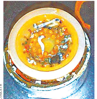
Два года назад тавдинцы сфотографировали червей в воде.

— Наши сотрудники всегда принимают жалобы жителей и ни в коем случае не отправляют их в сторонние фирмы. Пос-