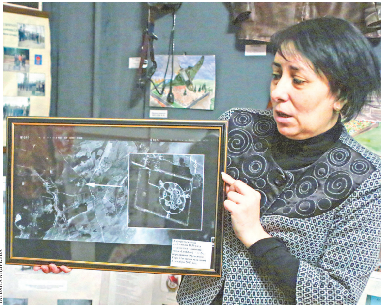
На фотографиях, сделанных с американских самолетов, видны детали советских объектов.