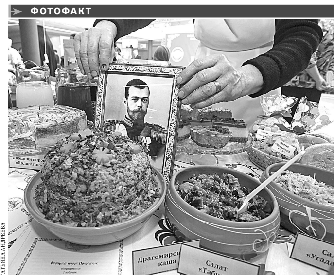
В Екатеринбурге проходит кулинарный фестиваль, приуроченный к 150-летию со дня рождения Николая II. В меню только постные блюда с царского стола. Готовят их известные горожане, священники, профессиональные повара. В списке угощений — «рис императрицы», драгомировская каша, печеные яблоки, оладьи из яблок и тыквы, салаты с морепродуктами, а также множество соусов с медом, вареньем, кислой и сладкой приправой.

Другой способ — лишение водительских прав. Если долг больше десяти тысяч рублей и есть решение суда о взыскании, но должник отказывается его погасить, пристав лишает автомобилиста водительских прав до тех пор, пока он полностью