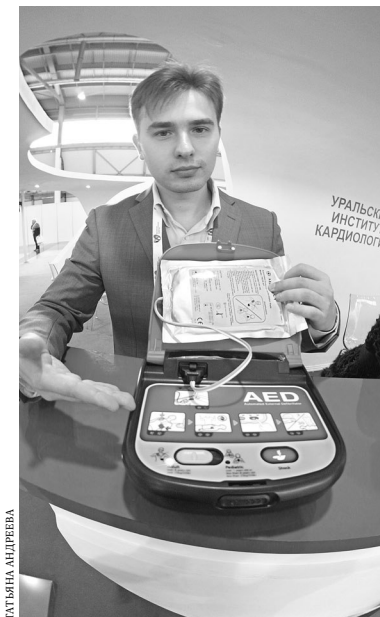
Компактные дефибрилляторы представили на международной выставке «Иннопром» в 2016 году.