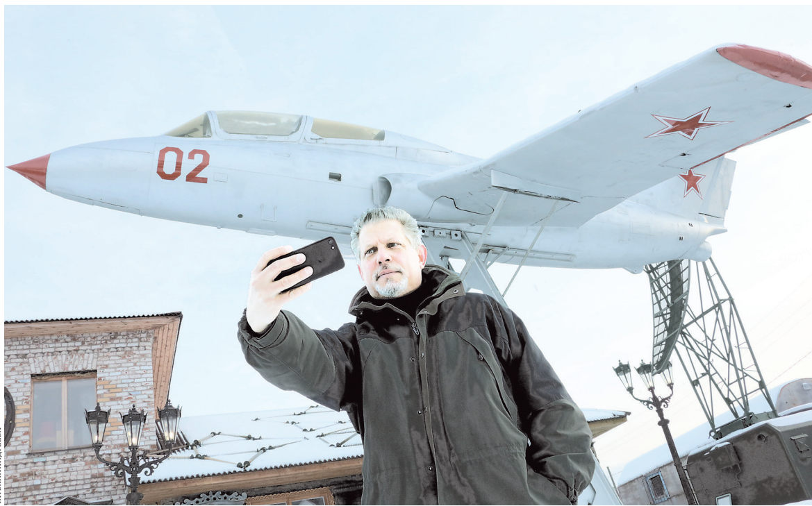
На Урале Пауэрс-младший фотографировался рядом с экспонатами народного музея, созданного краеведами-энтузиастами.

— По воспоминаниям очевидцев, такое забыть нельзя. Казалось, истребитель пикирует прямо на центральную улицу, по которой шла демонстрация. Но горящая машина внезапно выровнялась: пилот пытался увести ее подальше от жилых кварталов, — описала нам события того рокового Первого руководи-