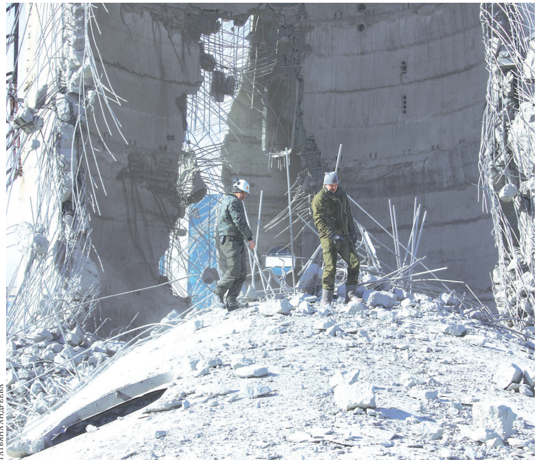
Фотокорреспонденту «РГ» одной из немногих удалось попасть внутрь разрушенной башни.