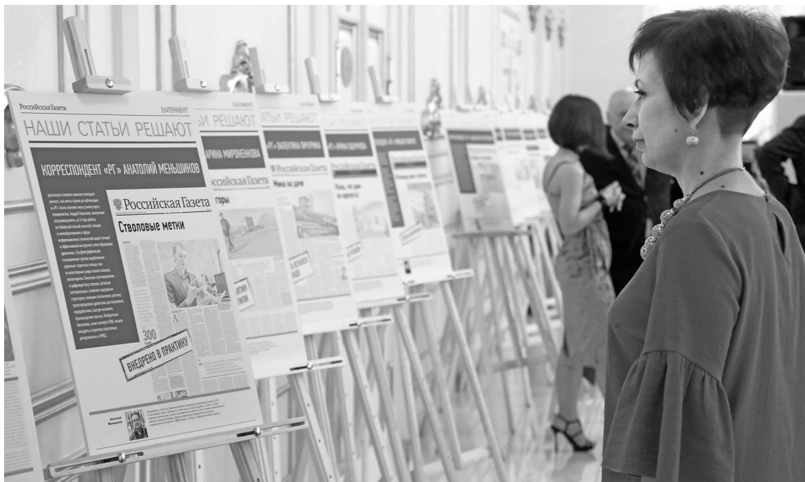
Гости вечера познакомились с публикациями журналистов «РГ», которые помогли отстоять веру людей в справедливость.