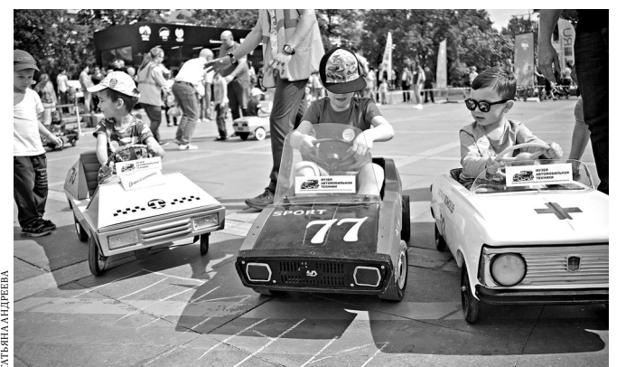
К гонкам допустили автомобили не моложе 30 лет.