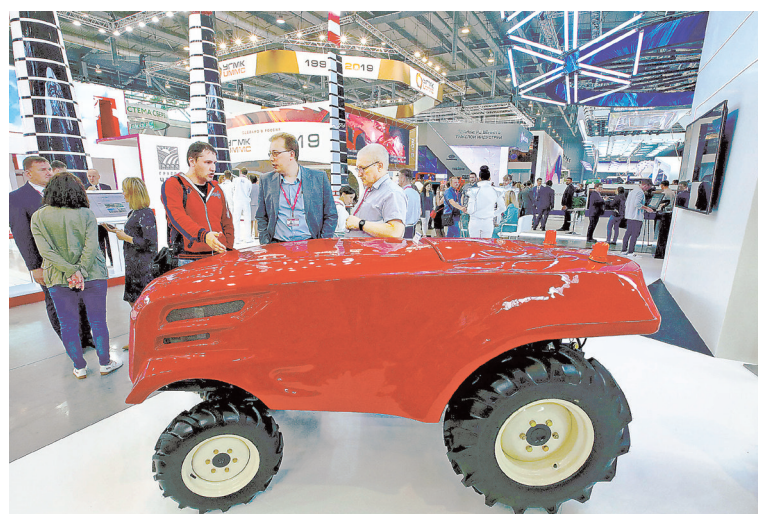
Беспилотный трактор способен накапливать знания.