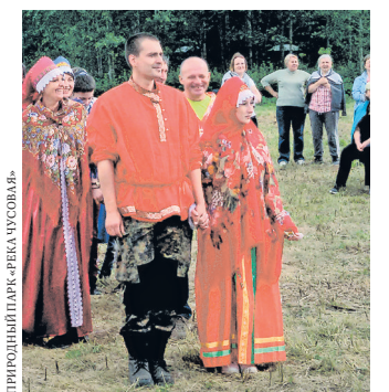
На фестиваль «Дух Урала» молодые люди пришли в аутентичных костюмах.