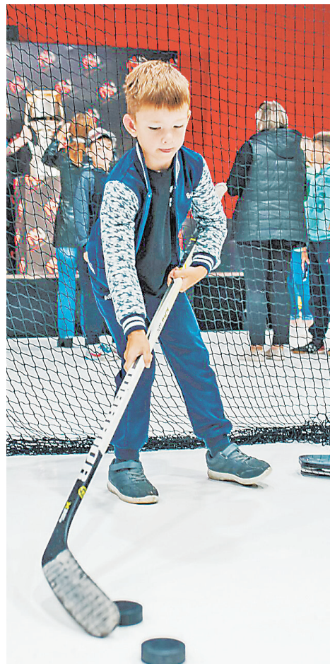
«NN CENTER» станет стартовой площадкой для юных хоккеистов.

— Важно, чтобы ребята не теряли связь со звездами хоккея. Живут где-то в Вашингтоне известные спортсмены, а на Южном Урале тысячи пацанов считают их небожителями. А если легенды спорта окажутся среди мальчишек, те будут рваться вперед, понимая, что у них есть реальный шанс стать такими же звездами. Рынок хоккея в Челябинске, пожалуй, сегодня самый крупный. Думаю, как только начнется учебный год, центр заполнится мальчишками и девочками. Благо, в городе есть люди, прошедшие школу «Трактора», есть очень сильные хоккеисты, владеющие методиками и навыками. И тогда в