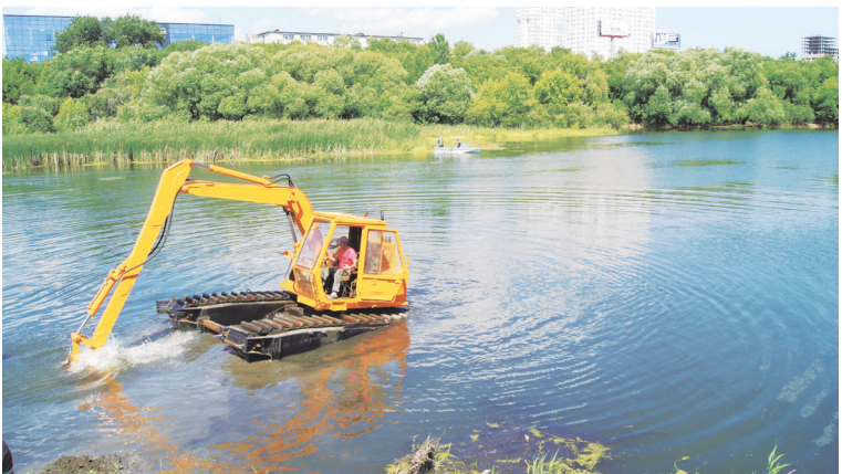
Плавающие экскаваторы избавят Миасс от водорослей и мусора.