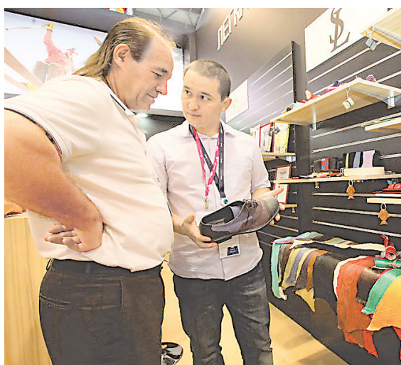
Кожа рыбы дешевле кожи рептилий, но выглядит так же дорого и изысканно.

Что интересного показали на Иннопроме-2019