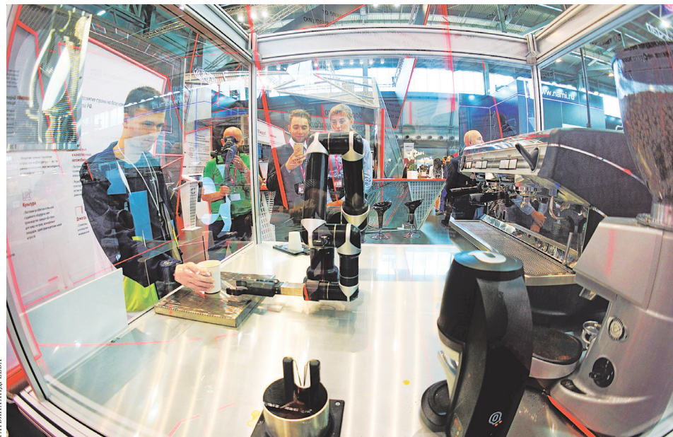
Робот-бариста никогда не допустит ошибку в приготовлении кофе.

Трактор видит препятствие — для этого он оснащен особыми камерами. Точность работы обеспечивает система коррекции спутникового сигнала — в результате максимальная погрешность движения составляет всего 10 сантиметров. Впрочем, совсем без гомо сапиенс трактор не обойдется, ведь