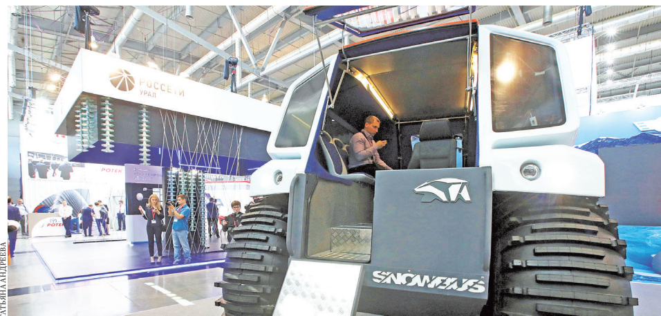
Компьютер беспилотного вездехода видит на 100–200 метров вперед.

В установке использованы кофе-машина и все необходимые приспособления для приготовления напитка. Ценность робота в том, что он всегда варит отличный кофе, ошибок у него не бывает. Правда, чтобы составить алгоритм его работы, потребовалась помощь настоящего бариста — призера профессиональных конкурсов. Стаканчик латте для корреспондента «РГ» робот сварил ровно за две минуты. На наш взгляд, напиток получился вкусным.