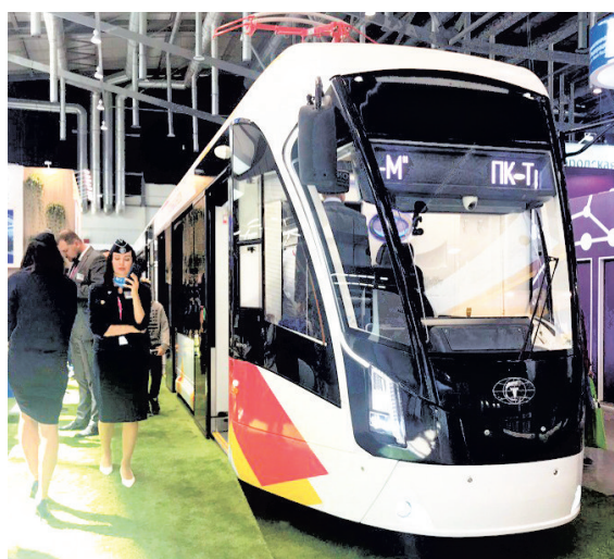
Перед препятствием трамвай автоматически остановится.