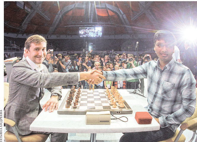
На открытии фестиваля сыграли шахматные звезды — Сергей Карякин и Пентала Харикришна.