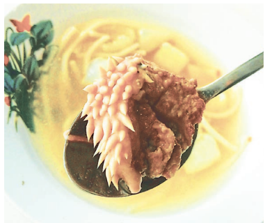
Есть такой суп вряд ли кто-то захочет.

В департаменте образования и науки Курганской области засомневались, что юргамышским школьникам дали суп с мясом неизвестного происхождения.