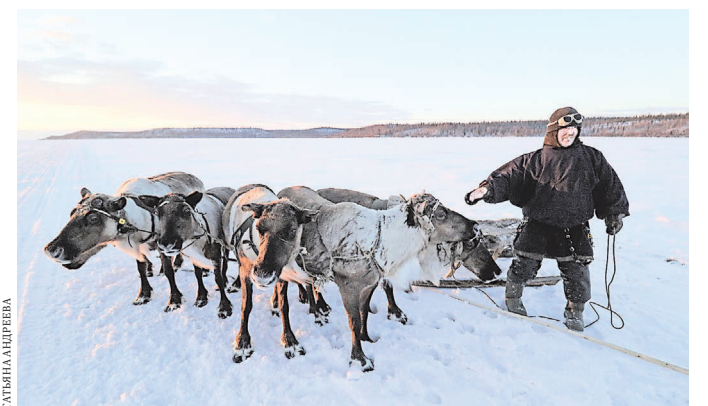
Ученые возлагают большие надежды на тундровиков в деле изучения погодных явлений Арктики.