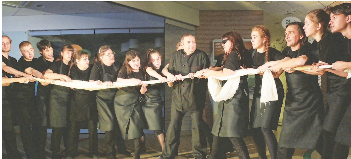
В спектаклях «Инклюзиона» заняты и молодые, и более зрелые артисты.

Театр-студия «ORA» — победитель в номинации «Культура» национальной премии «Мой проект — моей стране» Общественной палаты РФ. В ноябре 2018 года при поддержке Фонда президентских грантов при «ORA» создана инклюзивная театральная лаборатория, где обучаются незрячие, слабовидящие, глухие и слабослышащие студенты. В следующем году планируется набрать курс инклюзивного актера в театральном институте.