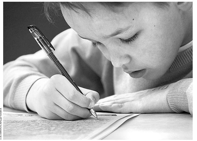
В Верхней Пышме участником акции стал восьмилетний мальчик.